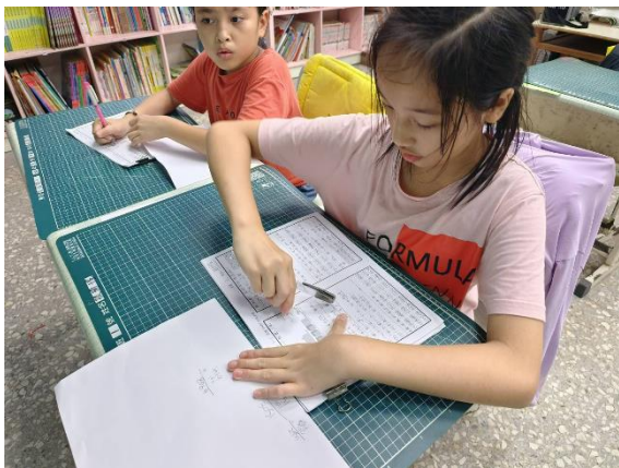
專注習寫練習卷或跟同學討論解題方式