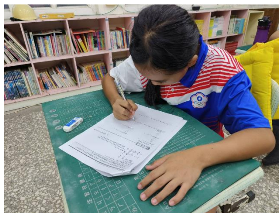
學生練習老師準備的相關教材資源