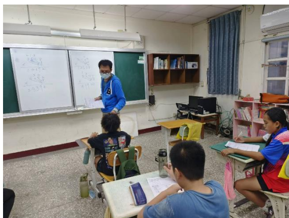
教師板書解題步驟、容易解題的方法