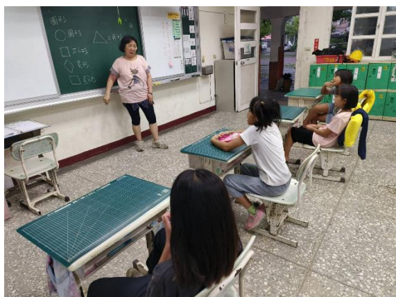
老師板書圓形、正方形、菱形、三角形